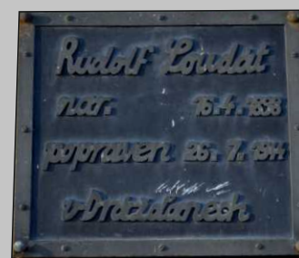
Současný vzhled pamětní tabule Rudolfa Loudáta v Chrastavě. (2017)