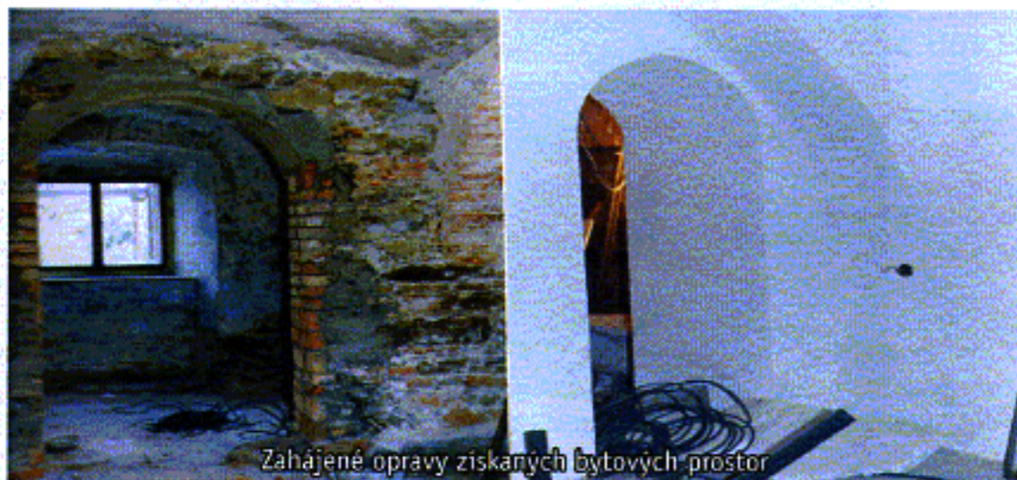
Zahájené opravy získaných bytových prostor

příkladem přesvědčovalo pochybovače a váhající, že se zamýšlená rekonstrukce zdárně podaří. Práce pokračují - dokončují se opravy bývalých bytových prostor, opravují se klenby v hlavním výstavním sále a v dílně po celý rok stále probíhají opravy nově získaných exponátů.