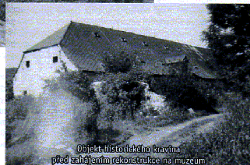
Objekt historického kravína před zahájením rekonstrukce na muzeum