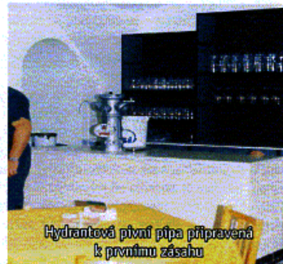
Hydrantová pívni pípa připravená k prvnímu zásahu

Slavnostnímu otevření „Muzea historické hasičské techniky“ v Chrastavě, které se uskutečnilo 21. června 1997 u příležitosti „Chrastavských slavností“ za velkého zájmu veřejnosti předcházelo neformální setkání a posezení těch místních hasičů, kteří se na výstavbě muzea různou měrou i různým počtem zdarma odpracovaných hodin podíleli. Spolu s nimi byli na setkání pozváni i jejich rodinní příslušníci jako výraz poděkování za několikaletou toleranci, kdy jejich partneři trávili mnoho hodin zdarma a na úkor rodiny na výstavbě muzea. Muzeum otevřeli významné osobnosti libereckého regionu v čele s přednostou Okresního úřadu v Liberci. První návštěvníci po slavnostním přestřžení pásky nešetřili chválou nad vytvořeným dílem, velmi si považovali pečlivé mravenčí práce při rekonstruování historické techniky a zejména však oceňovali nezdolné několikaleté svépomocné stavební úsilí chrastavských dobrovolných hasičů při realizaci jejich snu – vybudování expozice historické hasičské techniky v samostatném muzeu v Chrastavě.