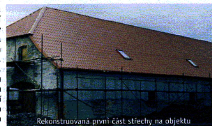
Rekonstruovaná první část střechy na objektu