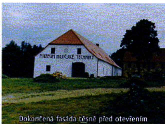
Dokončená fasáda těsně před otevřením

a poté vše upravit do původního stavu. Neuvěřitelnou výdrž a morální odolnost předvádí v této krizové době „zdravé jádro“ z party chrastavských hasičů. Závěrečnou vnitřní činností této fáze oprav je nutnost vymalovat všechny zrekonstruované prostory. O konečný úklid v celém objektu se obětavě postaraly opět členky sboru. Onou pomyslnou třesničkou na dortu se potom stala nová venkovní fasáda na celém muzeu včetně nápisu, kterou vyvrcholily mnohaleté práce na celém objektu.