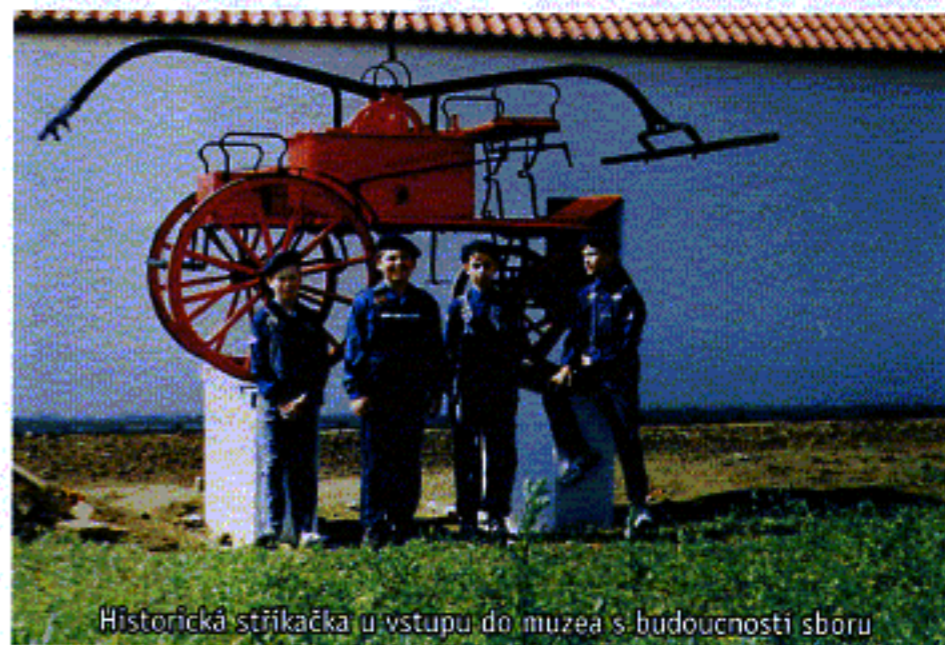
Historická stříkačka u vstupu do muzea s budoucností sboru

Poslední a závěrečný díl dlouholetého úsilí je instalace rekonstruovaných exponátů do vnitřních výstavních prostor. Ke každému vystavenému předmětu je také zhotovena