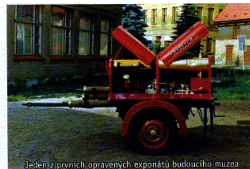
Jeden z prvních opravených exponátů budoucího muzea

Souběžně bylo v dílně sboru zkušenými mistry pokračováno na repasi získaných exponátů pro budoucí muzeum. Zvěst o tom, že v Chrastavě vzniká svépomocí hasičů muzeum se velmi rychle rozšířila s pozitivním ohlasem v celém regionu. A tak se chrastavským hasičům dařilo většinou s porozuměním u dobrovolných sborů získávat další historické předměty pro svoji zamýšlenou expozici a to i mimo okres Liberec. Obstarávání probíhalo dvojí formou; buď byl předmět přímo darován do muzea, o čemž byl sepsán zápis a nebo byl exponát do muzea jen zapůjčen s tím, že bude na jeho informační tabulce u vystaveného předmětu uveden majitel.