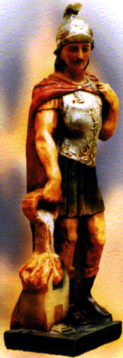
Svatý Florián - patron hasičů